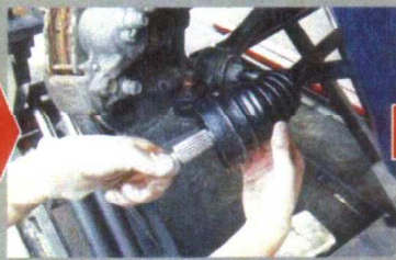
ブーツをジョイントにかぶせて