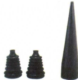
軽自動車用ブーツ