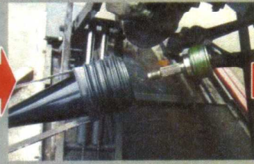
ジョイントにコーンをかぶせて