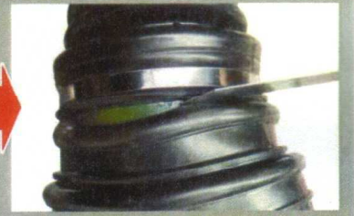
余りを切ったら出来上がり!!