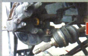
ハブからジョイントを抜いて