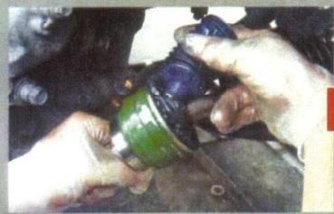
ジョイントにグリスを注入