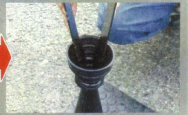
インサーターをそっと入れて