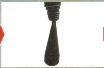
小さい方からコーンにかぶせて